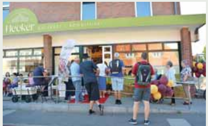
Geduld ist gefragt zur Geschäftseröffnung