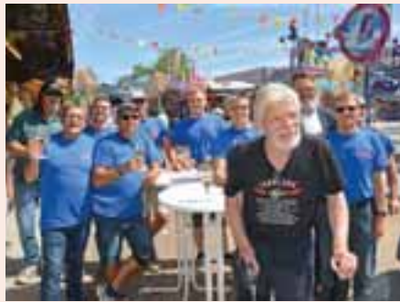
Die Runde hat Spaß, und noch einer mehr auch. Achten Sie bitte auf den Herrn hinten rechts.

Süderbrarup (uwa). Es ist ein offenes Geheimnis, dass unsere nördlichen Nachbarn, die Dänen, ein mit Lockerheit be-