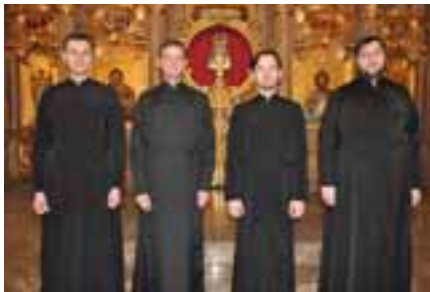
A Capella Oda Rachmaninov Foto Bondarenko, Text Johanna Heyland

Fortissimo, stimmungsgewaltigem Bassisten und Chor. Der Eintritt ist frei. Der Förderverein der Kirche bietet in der Pause Erfrischungen an, beim Ausgang wird um eine Kollekte für die Sänger gebeten.