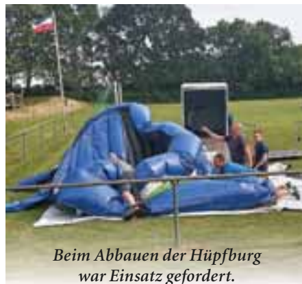
Beim Abbauen der Hüpfburg war Einsatz gefordert.

Zum Gelingen trugen viele freiwillige Helfer u.a. beim Getränkeauschank bei.