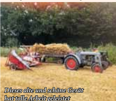
Dieses alte und schöne Gerät hat tolle Arbeit geleistet