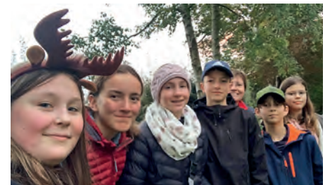
Naturdetektive 2022

31.03.: Wiesensamen und Wildbienen, Alter: 10–14; 28.04.: Kranichtanz und Katzenjammer, Alter: 5–9; 02.06.: Weidenbaum und Birkenblatt, Alter: 5–9; 02.06.: Jagdstein und Eichennase, 17:45–19:45 Uhr, Alter: 10–14; 30.06.: Entenflott und Froschkonzert, Alter: 5–9; 28.07.: Flattertier und Eulenaugen, 19:30–21:30 Uhr, Alter: 5–9; 11.08.: Sonne, Mond und Sterne, 19:00–??, Alter: 10–14; 15.09.: Wichtel und Wildwatze, Alter: 5–9; 13.10.: Bärenbrüder und Bienenschwestern, Alter: 5–9; 13.10.: Winterfutter und Herbstfarben, ab 17 Uhr, Alter: 10–14