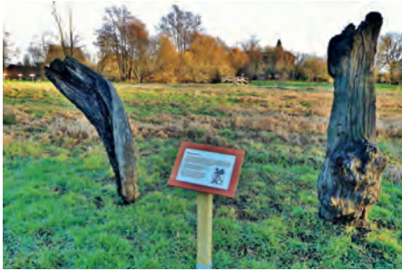
Neue Moostoft-Station: Über 600 Jahre alte Mooreichen

Frühjahrsarbeiten auch im Naturerlebnisraum „Moostoft“ in Ekenis! Hier musste der Weidentunnel einem neuen Schnitt unterzogen werden. Mit den Jahren waren die oberen Zweige so schwer geworden, dass die Weidenstämme zu brechen drohten. Vorstandmitglieder des Arbeits- und Förderkreises Erlebnisraum Naturgärten Ekenis (AFNE) e.V., der das Kleinod in Ekenis betreut, griffen zu Säge und Astschere und stützten die Weiden soweit, dass sie im kommenden Jahr wieder neu ausschlagen können (Foto). Frische Triebe wurden als Stecklinge in den Boden getrieben, um den Weidentunnel zu verjüngen. Auch sonst hat sich im NER Moostoft einiges getan. So wurde ein zusätzliches Pflanzenbeet für alte Stauden, von der