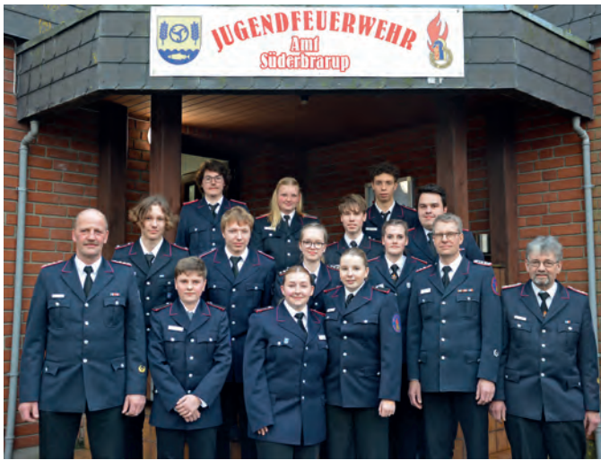
Erinnerungsfoto mit Vorstand, Betreuern und Amtswehrführung anlässlich der JHV der Jugendfeuerwehr im Amt Süderbrarup