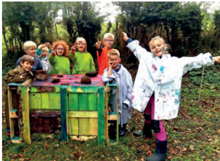
Naturdetektive 2022

Unter dem Motto „Wiesensamen und Wildbienen“ bereiten sie am 31.03. den Naturerlebnisraum auf einen hoffentlich artenreichen Sommer vor. Sie legen einen neuen Holzwall für das Käferhotel an und säen Wildblumen. Warum es wichtig ist, anders zu sein als andere, finden sie im Biodiversitätsspiel heraus. Die Jüngeren beginnen am 28.04. mit dem Thema „Kra-