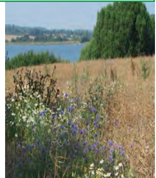
Am „Ostseefjord Schlei“

WEGWEISER: Die Strecke ist mit 13 Wegweisern ausgeschildert. SITZBÄNKE: Auf der gesamten Strecke befinden sich 20 Sitzbänke. Die gesamte Wegstrecke besteht aus vorhandenen, offiziellen Geh- und Radwegen der Gemeinden. Ausführliche INFORMATIONEN der Geschichte: siehe Info-Tafeln WANDER-FÜHRUNGEN: auf Anfrage – T. 04641-2176 u. 2013