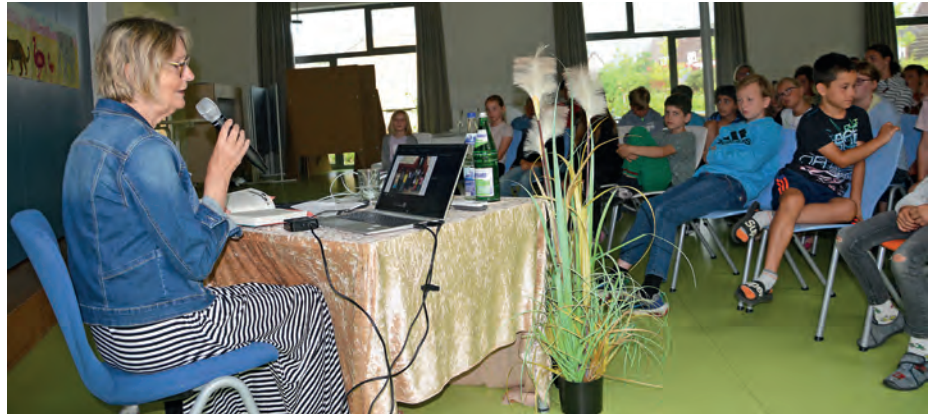
Kirsten Boie in Aktion, und zwar ausgesprochen gerne