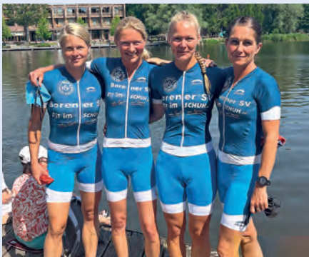
Das Damenquartett des BSV gewann in Eutin erstmals ein Ligarennen.

(bsv). Eine richtige starke Saison absolvieren die BSV-Damen in der Triathlon-Landesliga. Bereits vor dem letzten der fünf Wettkämpfe sind die Triathletinnen des Borener SV kaum noch von einem Medaillenplatz zu trennen und streben der Vizemeisterschaft entgegen.