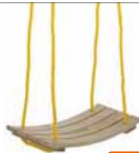
Brettschaukel Gebogen, 34 x 18 cm. Art.-Nr. 1193709