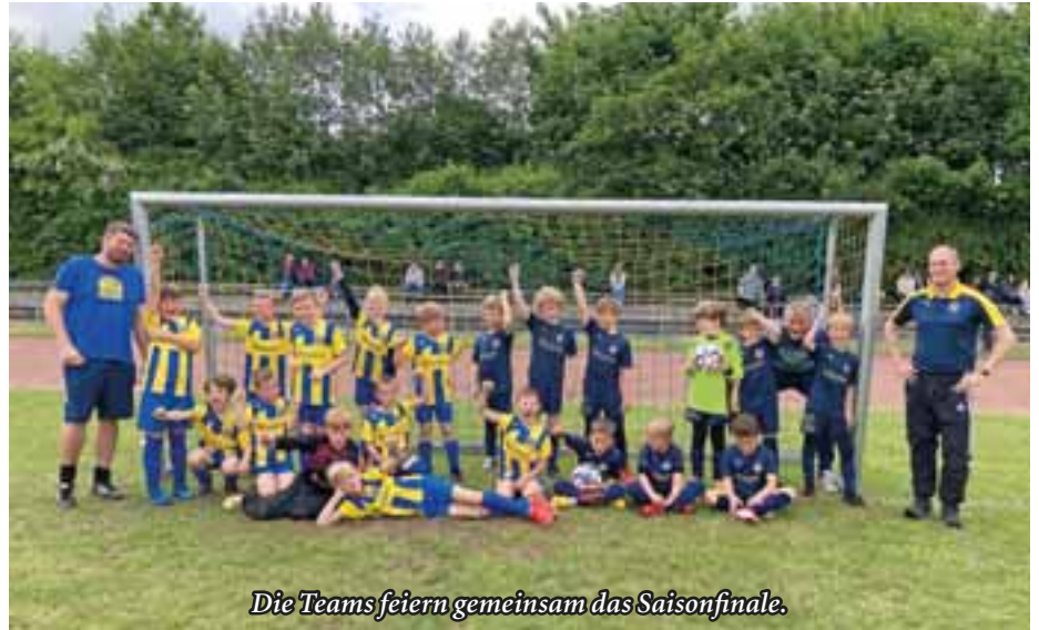
Die Teams feiern gemeinsam das Saisonfinale.