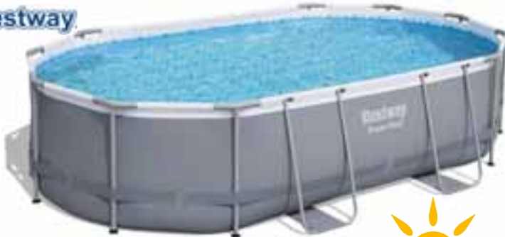
Power Steel Pool Set 488 x 305 x 107 cm. Art-Nr. 1718574