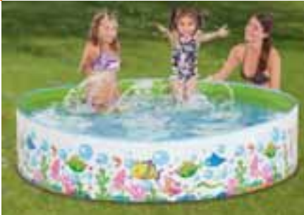
Steilwand-Pool 180 x 38 cm, Ocean-Design. Art-Nr. 1702671