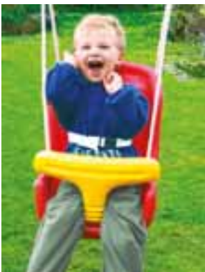
Baby-Sicherheits-schaukel Mit Sicherheitsgurt. Art.-Nr. 1078806