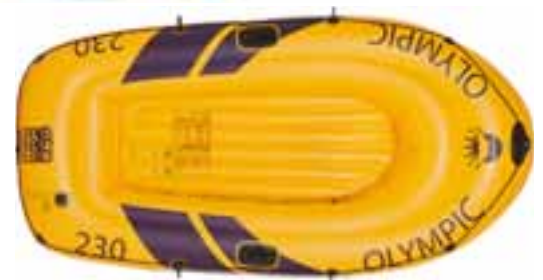
Sportboot Olympic 260er 252 x 125 x 40 cm, bis 210 kg. Art-Nr. 1653922