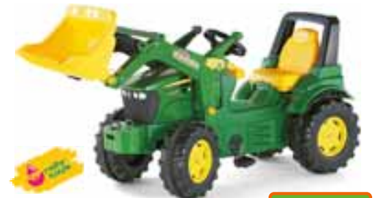
John Deere 7930 Tretraktor, mit Frontlader. Art.-Nr. 1159172