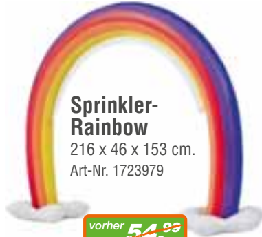
Sprinkler-Rainbow 216 x 46 x 153 cm. Art-Nr. 1723979