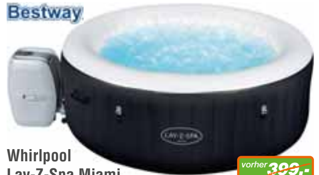
Whirlpool Lay-Z-Spa Miami H 65 x Ø 180 cm, inkl. Abdeckung. Art-Nr. 1718570