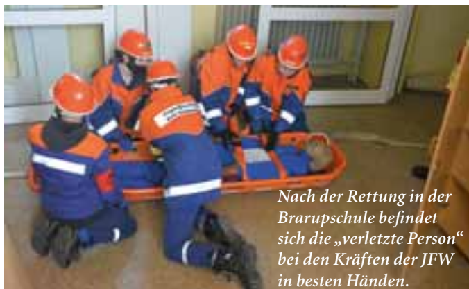
Nach der Rettung in der Brarupschule befindet sich die „verletzte Person“ bei den Kräften der JFW in besten Händen.