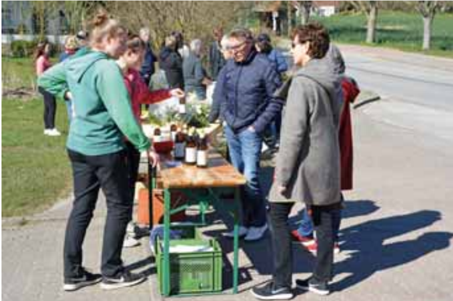
Schöne Stimmung beim kleinen aber feinen Wochenmarkt in Ulsnis