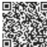
QR-Code zum Video

Ob in der Filiale oder online - so bänken wir in Schleswig- Mittelholstein.