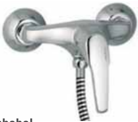
Einhebel- Brausebatterie Aquanova Plus Ohne Brause. Art.-Nr. 1102331