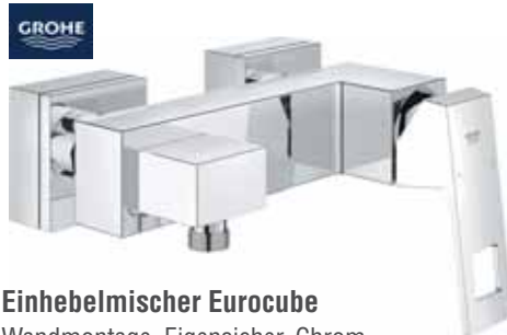
Einheilmischer Eurocube Wandmontage, Eigensicher, Chrom.