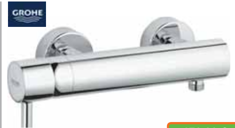
Einhand-Brausebatterie Essence, Chrom. Art.-Nr. 1375937