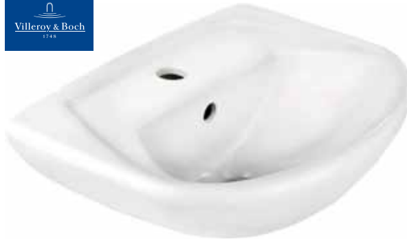
Waschtisch Omnia Classic Compact 60 x 45 cm, weiß, C-Plus, 1 Hahnloch mit Überlauf. Art.-Nr. 1213532