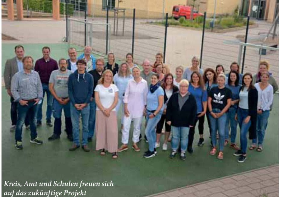
Kreis, Amt und Schulen freuen sich auf das zukünftige Projekt

meinschaftsschule) entsprechend instruiert, eingewiesen und koordiniert werden. „Wir freuen uns sehr auf diese Aufgabe in einem stark motivierten und engagierten Team“, so deren Einlassung zu diesem Thema, in dem sie das hohe Level an Flexibilität beim Zusammenwirken lobend herausstellten.