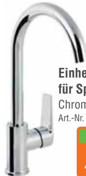
Einheilmischer für Spüle Chrom. Art.-Nr. 1664516