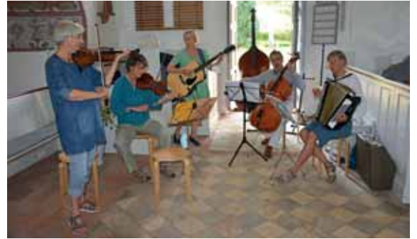
Das musikalische Begleitprogramm der Folk-Gruppe „Cantüdel“ kam prima an