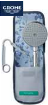
Raindance TravelKit Art.-Nr. 1257270