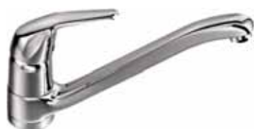
Spültisch-Einheilmischbatterie Aquanova Plus, mit schwenkbarem Gussauslauf. Art.-Nr. 1102324