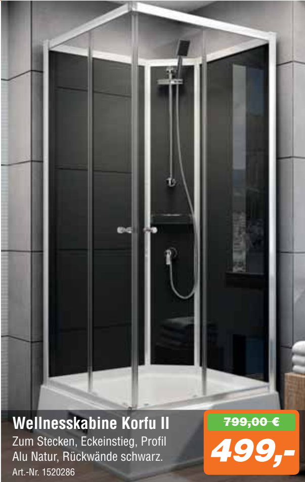
Wellnesskabine Korfu II Zum Stecken, Eckeinstieg, Profil Alu Natur, Rückwände schwarz. Art.-Nr. 1520286